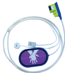
CPR Uni-padz Übungs-Elektrodegurt Artikelnr.: 8028-000010

ZOLL Medical Corporation Hauptgeschäftssitz 269 Mill Road Chelmsford, MA 01824 978-421-9655 800-804-4356